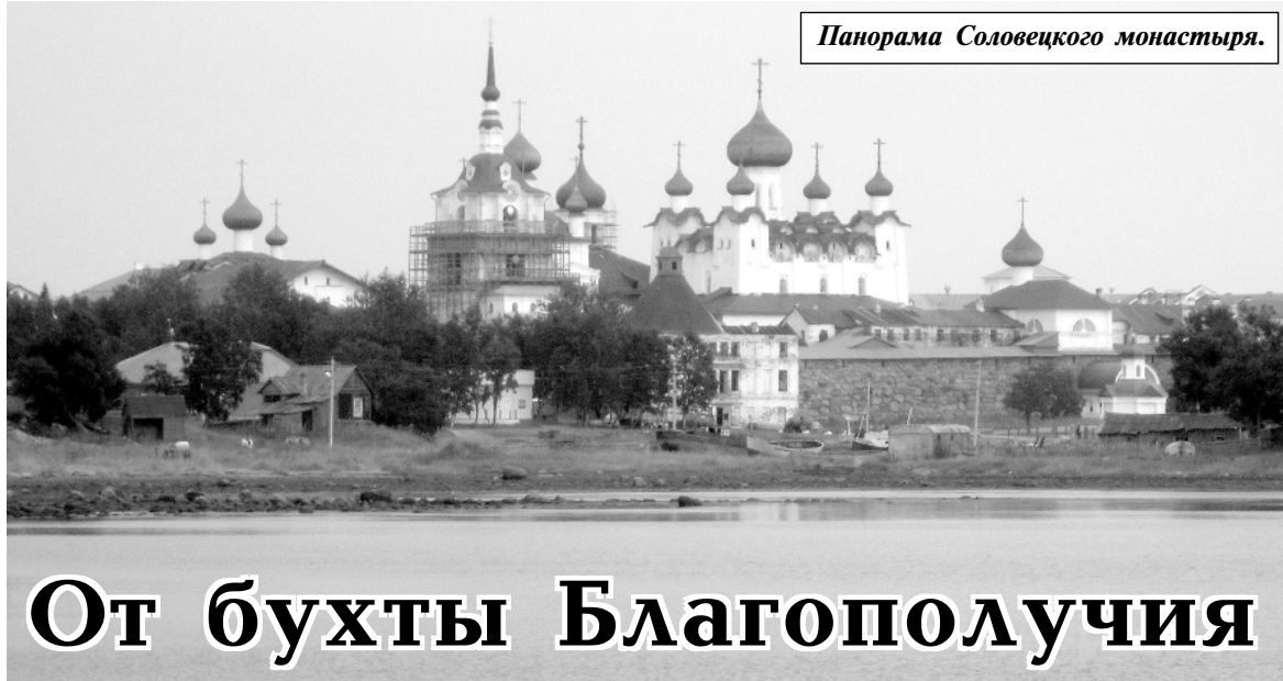
Панорама Соловецкого монастыря.

В северной части острова, на Секирной горе, в 12 км от мо-