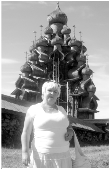
Автор на фоне Кижского ансамбля.

тысячелетия до нашей эры. Сюда приходили рыболовы и охотники на морского зверя (когда-то на островах в изобилии водилась нерпа). Только в XV веке на Соловки прибывают, ища уединения, отшельники Савватий и Герман, основатели монастыря. Экскурсоводы рассказывают легенду Секирной горы, которая выбита там на камне, - пришли ангелы и высекли жену рыбака, чтобы она убралась с острова. Это была не просто жена рыбака, а хозяйка острова! В дальнейшем идет просто передел собственности - хозяйку выгоняют, дают мизер-